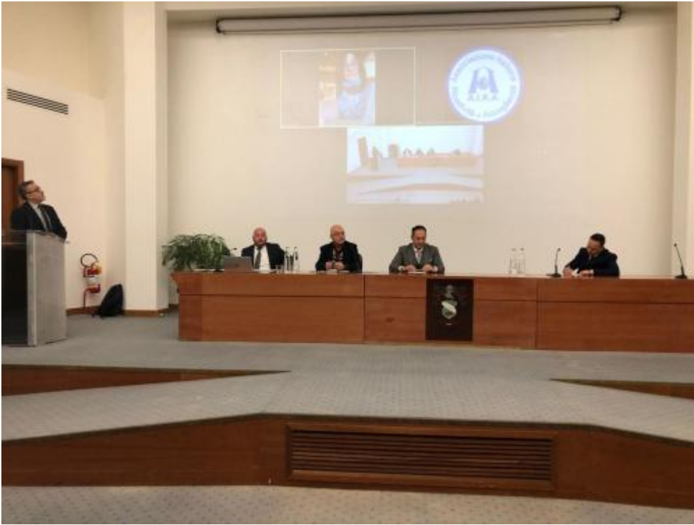
gran premio AIRA 2023-1