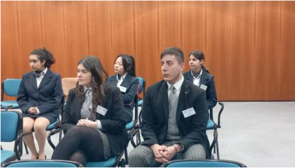
gran premio AIRA2