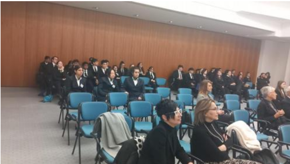
gran premio AIRA6