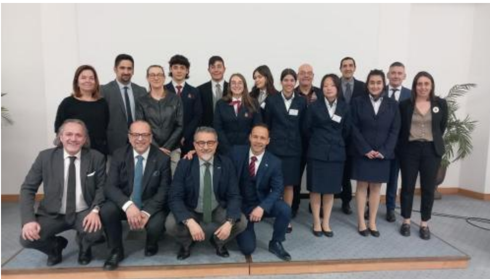
gran premio AIRA4