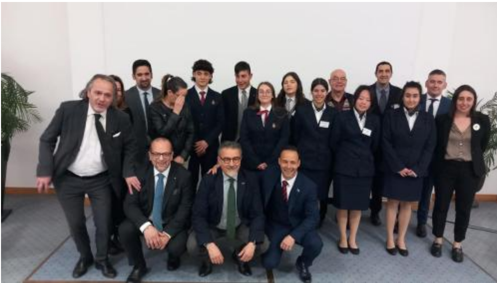
gran premio AIRA3