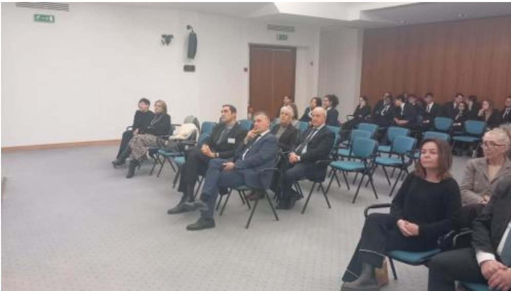
gran premio AIRA-Assisi