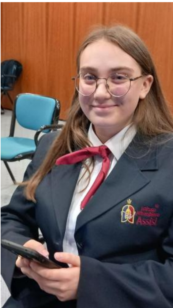
gran premio AIRA1