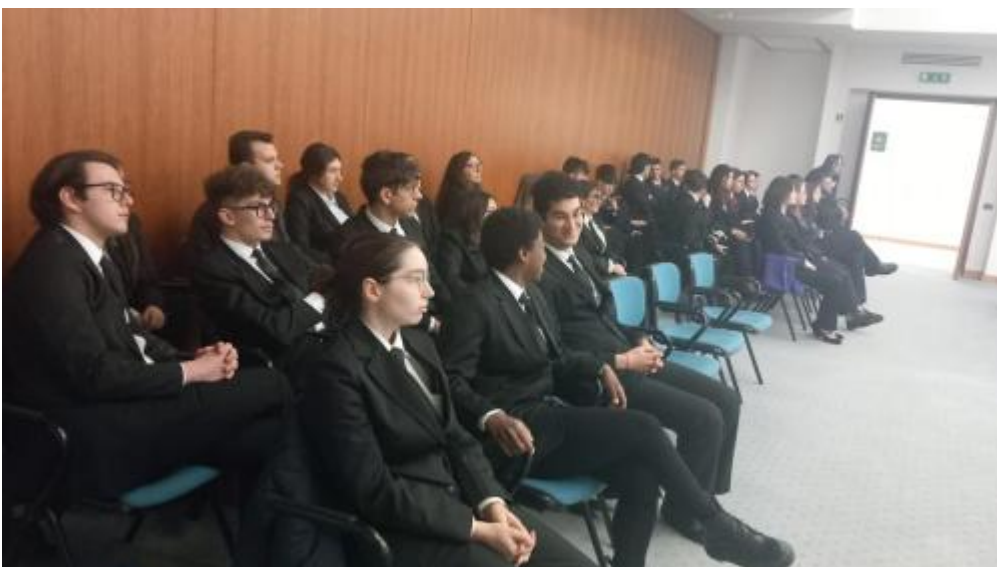
gran premio AIRA7