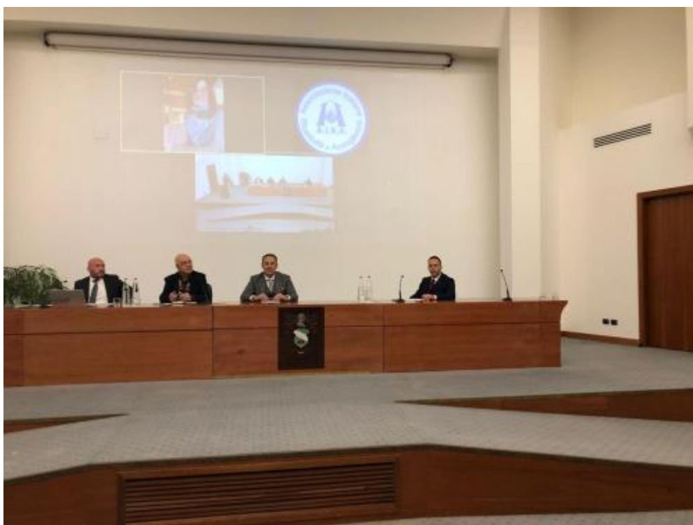
gran premio AIRA 2023