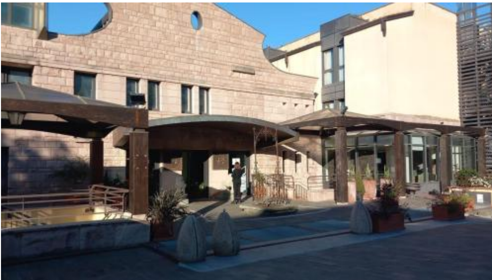
gran premio AIRA-Assisi1