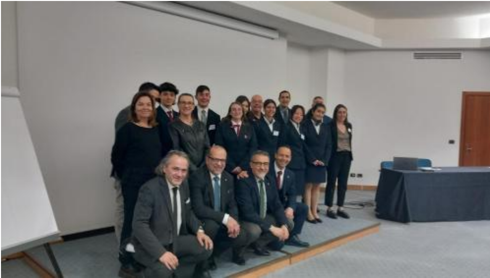
gran premio AIRA5