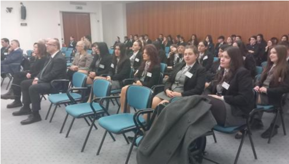
gran premio AIRA8